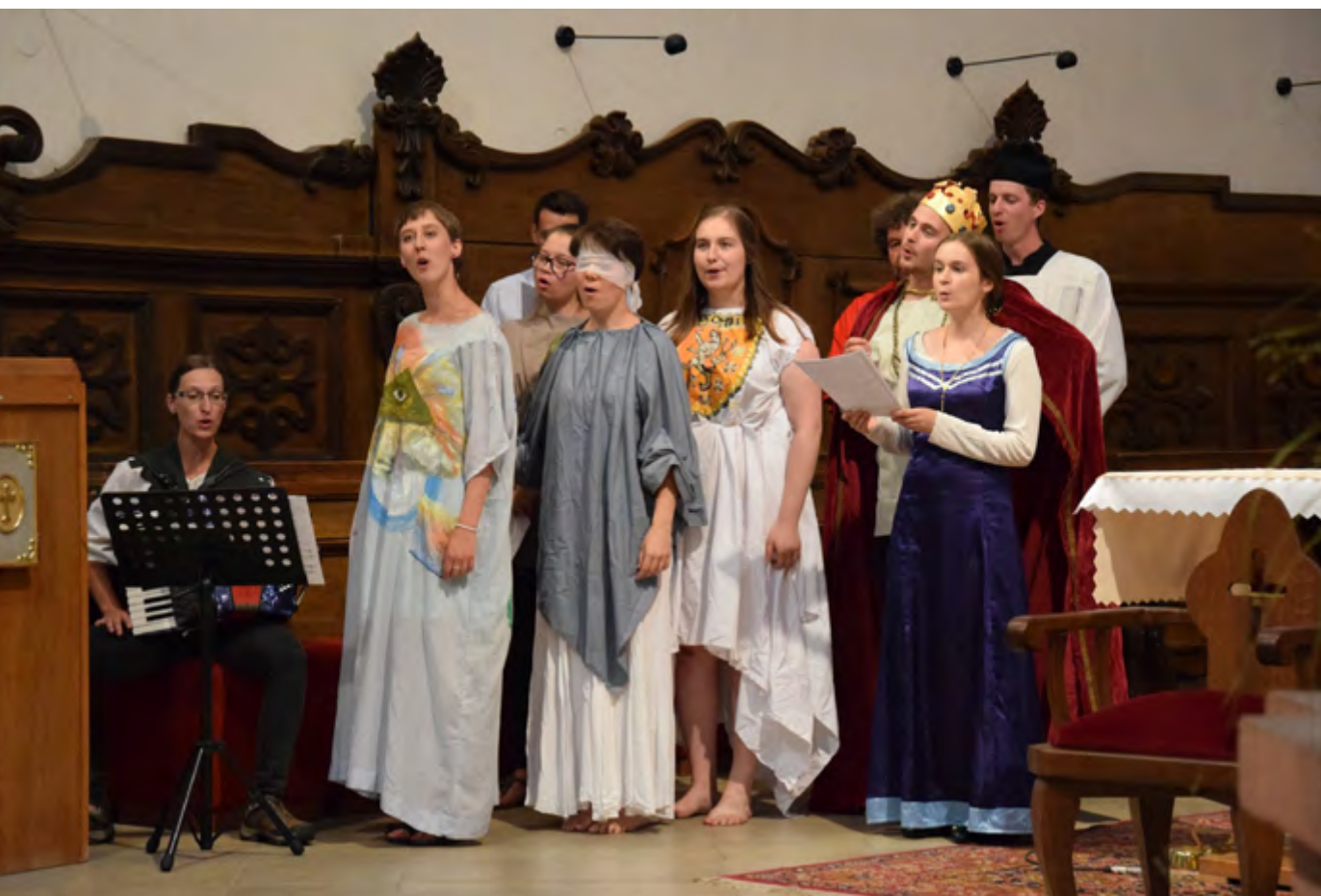
Studentské divadlo při vystoupení v Litomyšli, léto 2021