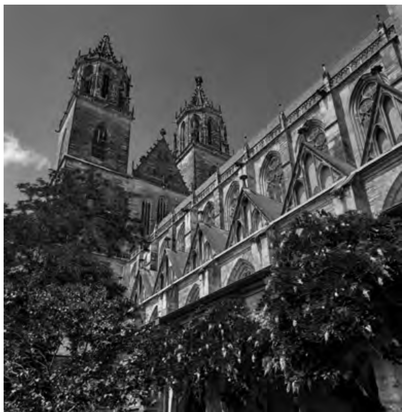
dóm v Magdeburgu

Zbytek letního semestru jsme věnovali přípravě našich závěrečných prací. Ty jsme úspěšně odprezentovali a studium zakončili několikadenní exkurzí přímo po Lužici. Domů jsme se vrátili bohatší o spoustu zážitků, zkušeností, znalostí a kontaktů. Takže co dodat na závěr? Až se k vám dostane možnost studijního pobytu v zahraničí, neváhejte a určitě vyrazte. Stojí to za to. Riskujete tím leda to, že se vám pak bude stýskat.