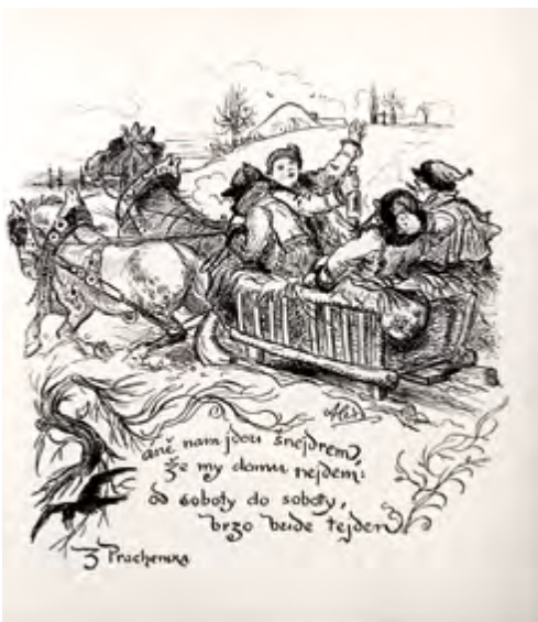
M. Aleš, Saně nám jedou šejdrem, ze Špalíčku, r. 1893