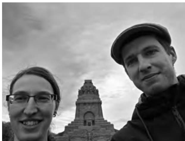
na Erasmus s úsměvem

Čím omezenější byl kvůli covidu přístup na univerzitu, tím víc jsme se věnovali putování po Lipsku i jeho širo-