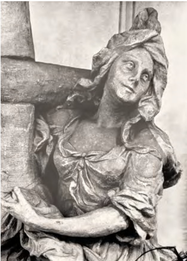
Kuks, r. 1718, M. Braun, socha Víry