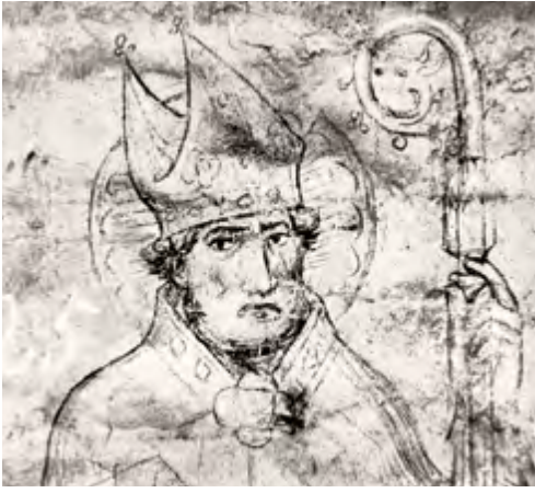
Karlštejn, kaple sv. Kříže, sv. Vojtěch, kresba štětcem na omítce