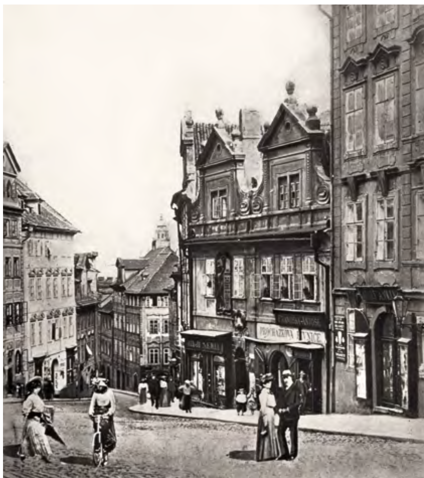
Praha, Ostruhová ulice č. p. 233, Dům u dvou slunců