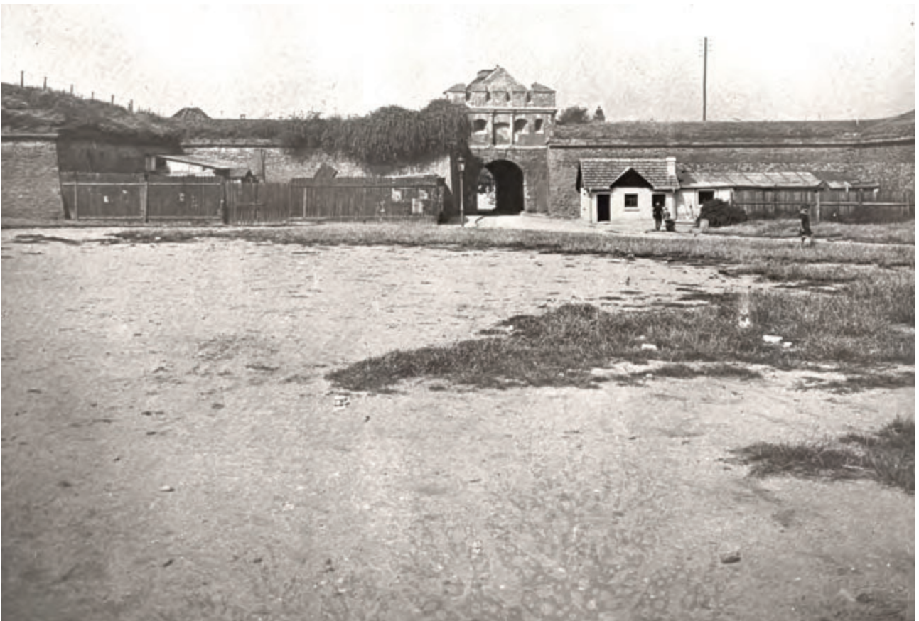
Praha, Vyšehrad, Táborská brána