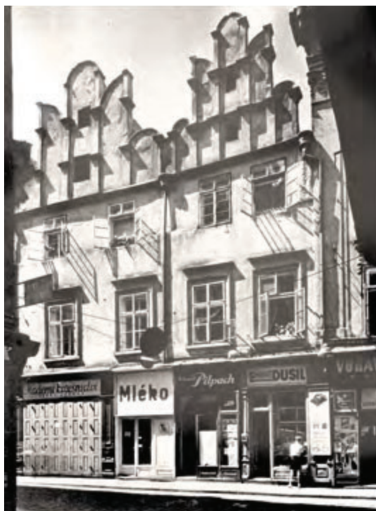
Praha, Husova ul. č. p. 229