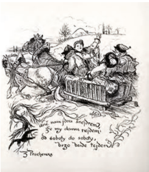
M. Aleš, Saně nám jedou šejdrem, ze Špalíčku, r. 1893