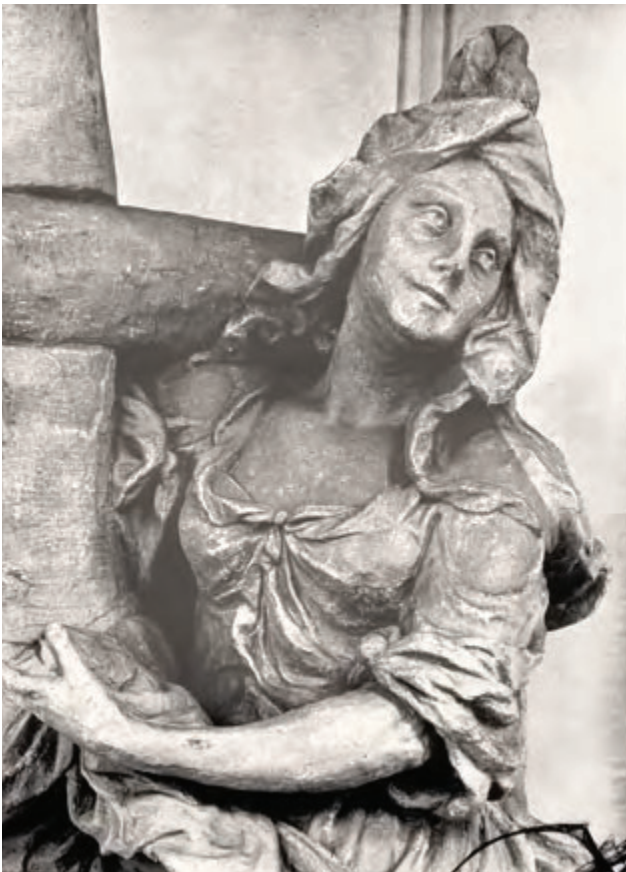
Kuks, r. 1718, M. Braun, socha Víry