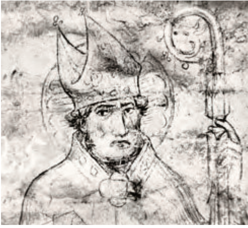
Karlštejn, kaple sv. Kříže, sv. Vojtěch, kresba štětcem na omítce