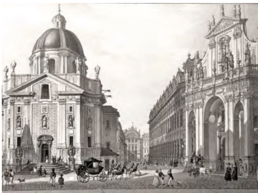
Křížovnické nám., 19. stol.