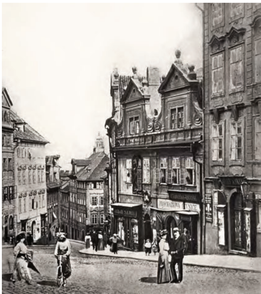
Praha, Ostruhová ulice č. p. 233, Dům u dvou slunců