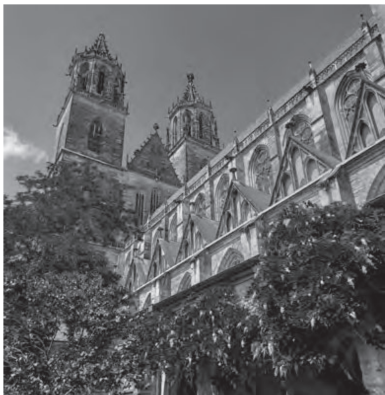
dóm v Magdeburgu

Zbytek letního semestru jsme věnovali přípravě našich závěrečných prací. Ty jsme úspěšně odprezentovali a studium zakončili několikadenní exkurzí přímo po Lužici. Domů jsme se vrátili bohatší o spoustu zážitků, zkušeností, znalostí a kontaktů. Takže co dodat na závěr? Až se k vám dostane možnost studijního pobytu v zahraničí, neváhejte a určitě vyrazte. Stojí to za to. Riskujete tím leda to, že se vám pak bude stýskat.