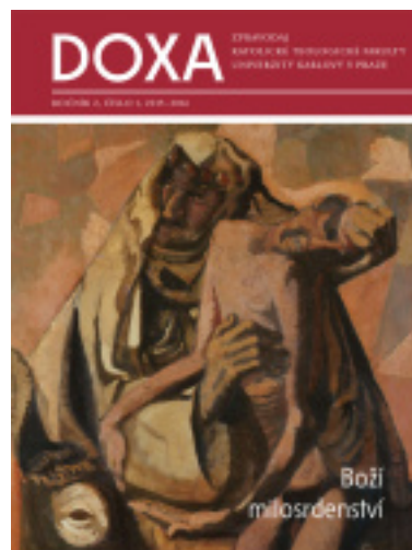
3/2016 Boží milosrdenství