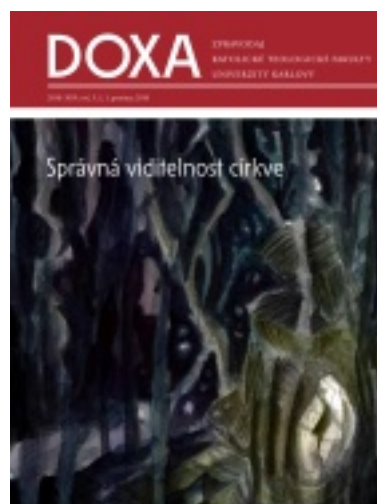
9/2018 Správná viditelnost církve