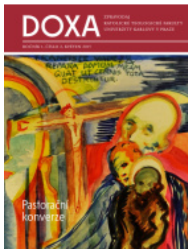
2/2015 Pastorační konverze