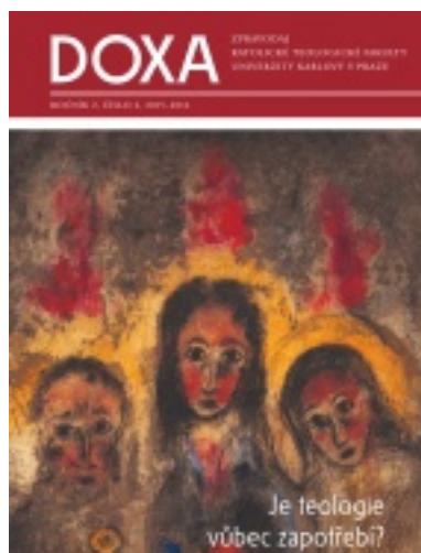
4/2016 Je teologie vůbec zapotřebí?