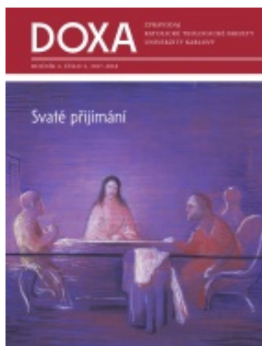
8/2018 Svaté přijímání