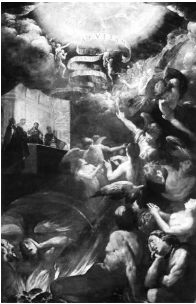
CRESPI, Giovanni Battista Duše vystupující na nebesa, 1617 San Vittore, Varese

Súvisí so všeobecnou neochotou uvažovať o tejto téme inak neprijatie základného vzťahového rozmeru života – faktu, že sme v nejakej forme neustále na sebe navzájom závislí, nie je možné sa tomu vyhnúť a v istých obdobiach sa to prirodzene stáva intenzívnejším a zjavným?