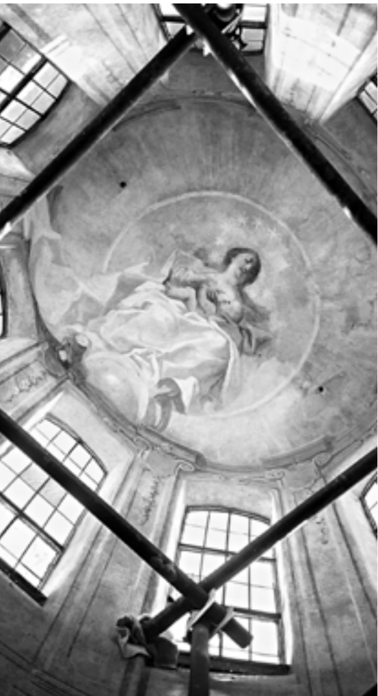
Kostel Panny Marie Vítězné na Bílé Hoře

Dodejme, že pozornosti by neměla uniknout ani „akreditační“ formulace listu, jímž Karel oslovil řádové kapituly, aby vyslaly do Prahy studenty teologie, kteří by se tu posléze stali magistry, aby tak univerzita dosahovala kvalit učení pařížského a oxfordského. S užitím majestátního plurálu Karel psal o „naší univerzitě“ a o „našem pražském učení“, jež je dobrotivostí Apoštolského stolce privilegováno do té míry ( adeo apostolice benignitatis grato presidio privilegiatum existat ), že se tam může konat všechno to, co je dovoleno ostatním obecným učením. Dopis, obsažený ve sbírce Collectarius perpetuarum formarum , není datován. Snad vznikl záhy po r. 1355 – Karel se označuje za císaře a současně hovoří o univerzitě jako „nové sadbě“. Obsahově text koresponduje s tím, co uvedl ve své kronice níže zmíněný František Pražský.