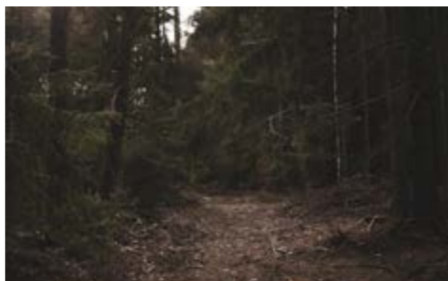
Studentské básně jsou doplněny fotografiemi Kláry Krásenské